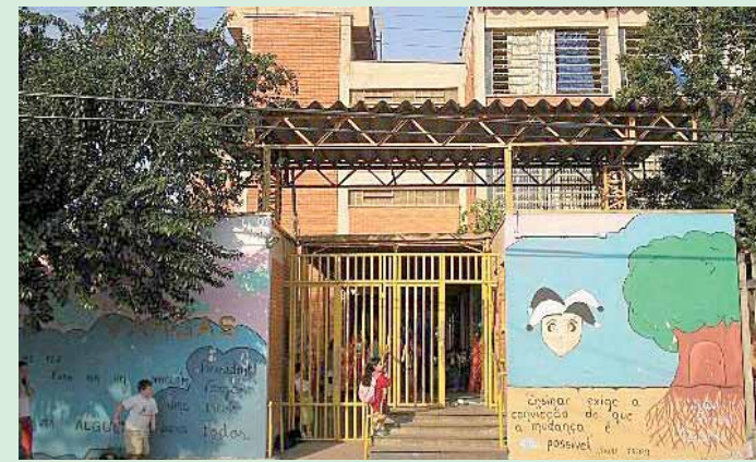
Escola é toda cor nos 50 anos