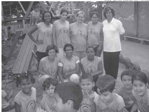
Equipe e crianças em abril de 2007

A festa ocorrerá no dia 15 de junho, e além do almoço, terá Missa Festiva, às 10h, com a participação de crianças atendidas e familiares e à tarde segue com festejos populares. O local do evento é a Paróquia Estudantil Nossa Se-