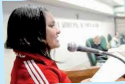
Estudante na Tribuna da Câmara

No dia 26 de maio foi a vez dos alunos de 8ª série da Escola Estadual de Ensino Fundamental Bento Gonçalves participarem da Plenária do Estudante na Câmara de Vereadores de Porto Alegre, onde "aprovaram" projeto que determina a abertura do