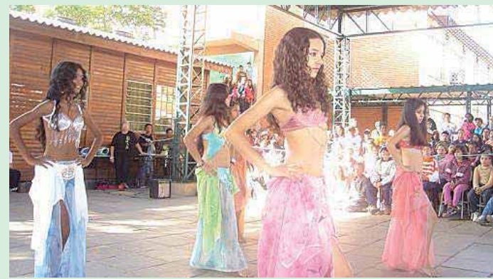
Grupo de Dança do Ventre

atividades culturais na Escola". Para participar dessa festa, entre em contato com a escola (Rua Aurora do Amarel Lisboa, 60 - Passo das Pedras).