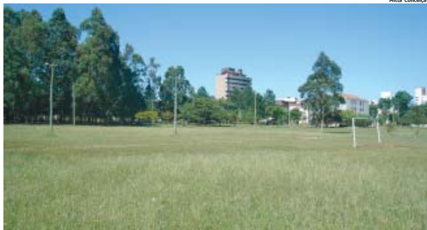
Praça Miguel Anibal Genta, com prédios da João Scalabrini ao fundo