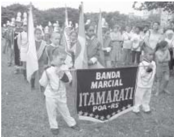
Banda Marcial encantou aos presentes e quer continuar encantando muitas outras gerações